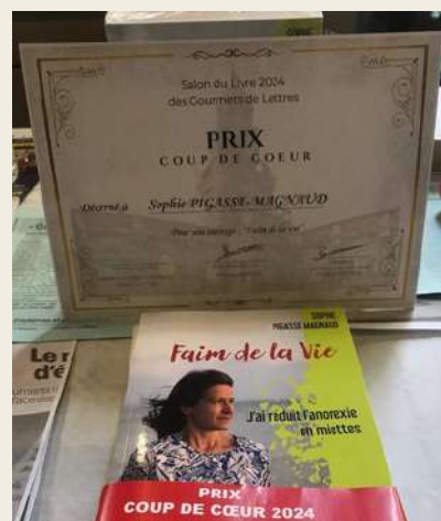
Faim de vie récompensé par l'association Les Gourmets des lettres de Toulouse