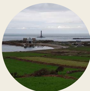
Goury - La Hague